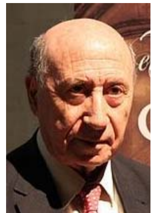
José M a Pérez, "Peridis"

Este curso la conferencia magistral (16:45) versará sobre "Reflexiones sobre la intervención en el patrimonio monumental" y correrá a cargo del Arquitecto José M a Pérez González, "Peridis". José María es bien conocido en el panorama científico-técnico por su labor técnica y de gestión en el patrimonio construido (decir que es Presidente de la Fundación Santa María la Real); además, para el público en general, es famoso por sus constantes apariciones en televisión gracias a series como "Las claves del Románico" o "La luz y el misterio de las catedrales"; por sus dotes de dibujante, buen ejemplo son las tiras humorísticas que ha venido publicando en el periódico "El País" desde 1976; o, más recientemente, por sus dotes de escritor de novela histórica ("Esperando al rey" Premio Alfonso X el Sabio de novela histórica 2014). Además de este último reconocimiento, atesora, entre otros, la Medalla de Oro de la Real Academia de Bellas Artes de San Fernando, la Medalla de Oro al mérito del Trabajo en Marzo, el Premio Patrimonio de la Junta de Castilla y León, varios Premios Europa Nostra o la Medalla de Plata al mérito turístico.